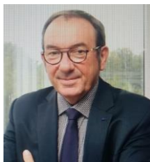
Alain BAVAY Président du Pôle Métropolitain de l'Artois Commission transversale éco- transition